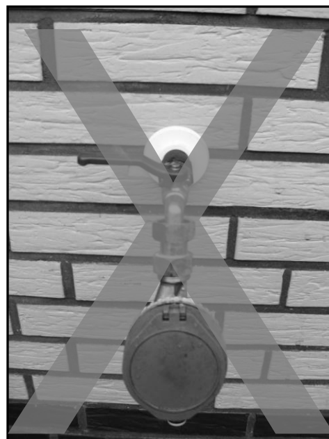
Nicht zulässige Installation eines Zwischenzählers